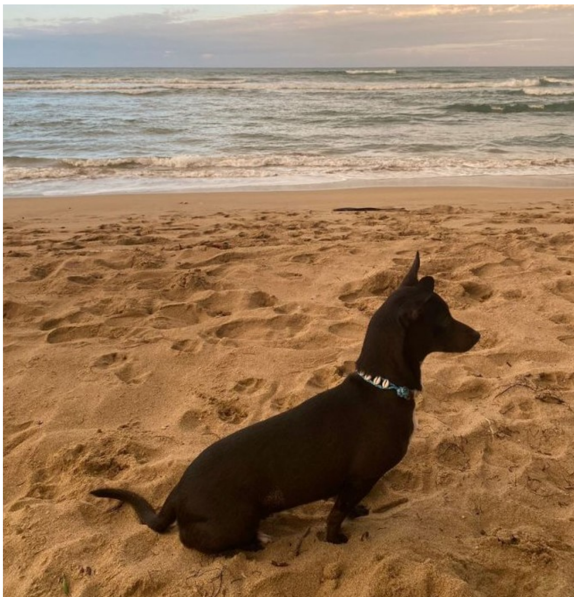
La cagnolina Maia

La 25enne avrebbe dovuto ricongiungersi a Maia il giorno dopo ma, purtroppo, non è stato così. Due giorni dopo il rientro a casa, la ragazza è stata informata dalla compagnia aerea che la cagnolina era scappata.