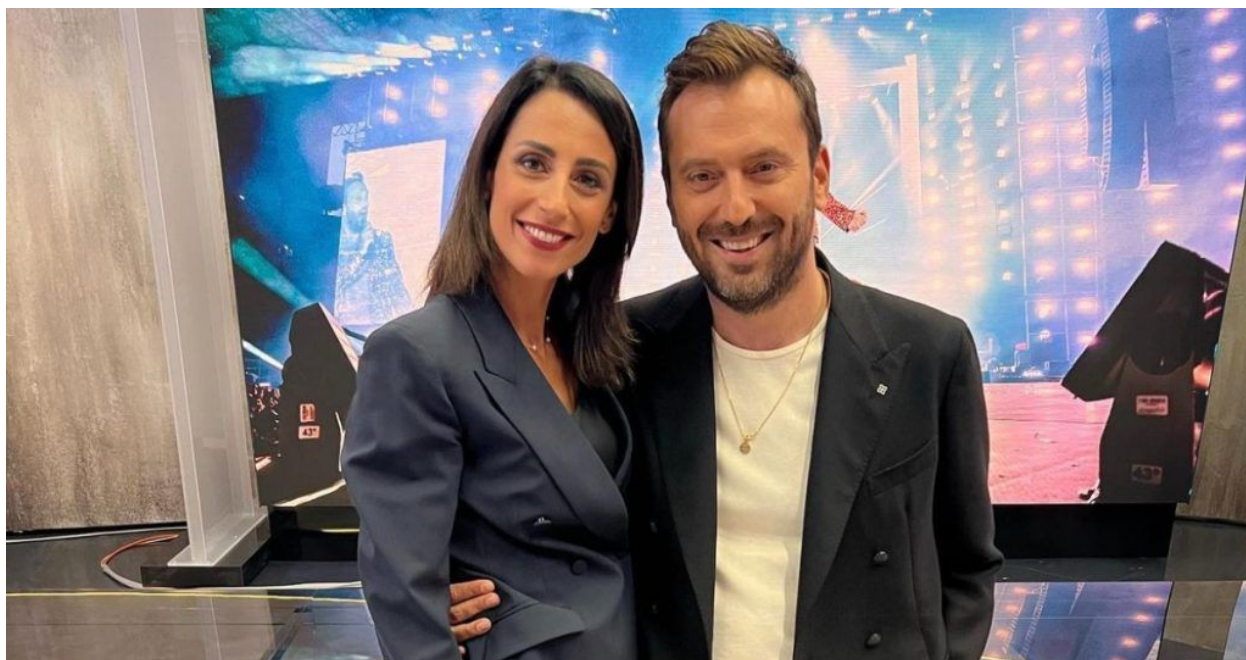
Cesare Cremonini e Giorgia Cardinaletti

Cesare Cremonini si lega nel 2009 alla cantante Malika Ayane, anche se la relazione naufraga nel 2011, anche se i due sono rimasti in buoni rapporti.