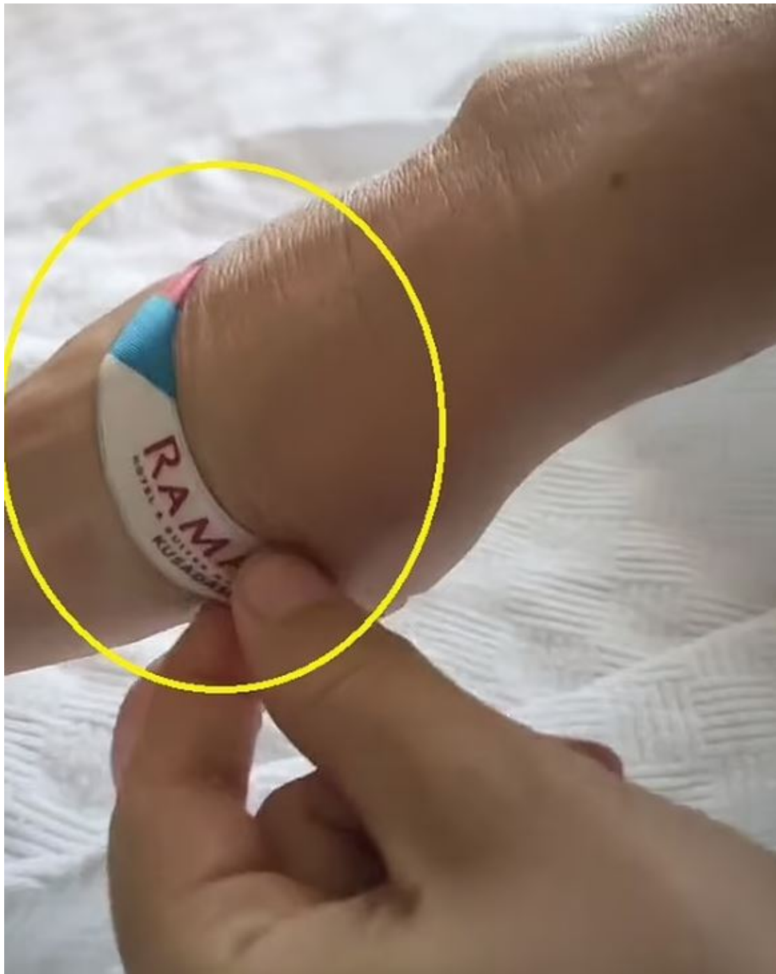
Il trucchetto del braccialetto

fantastico “, commenta la 39enne soddisfatta.