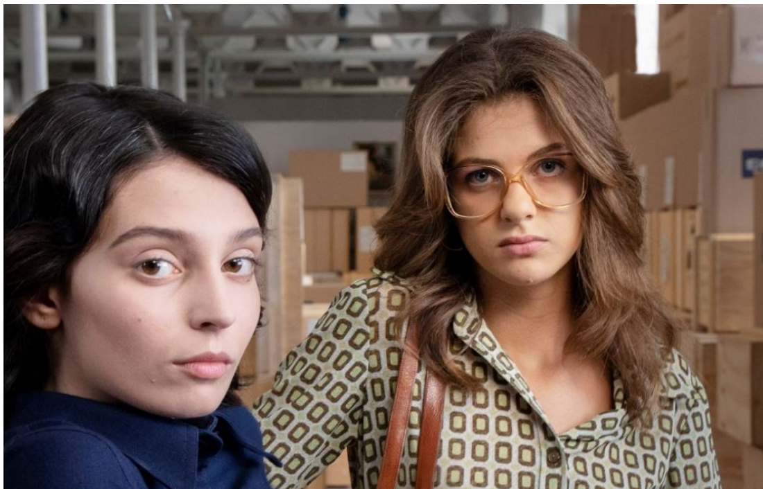
L'Amica Geniale 3