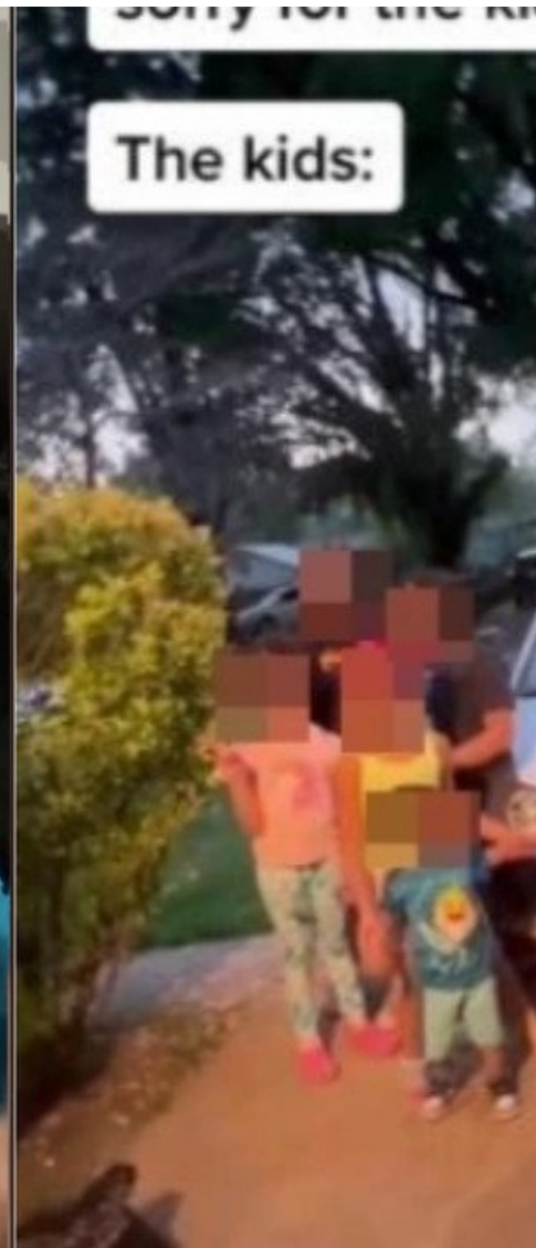
Phi, mamma di 11 figli da 8 padri diversi