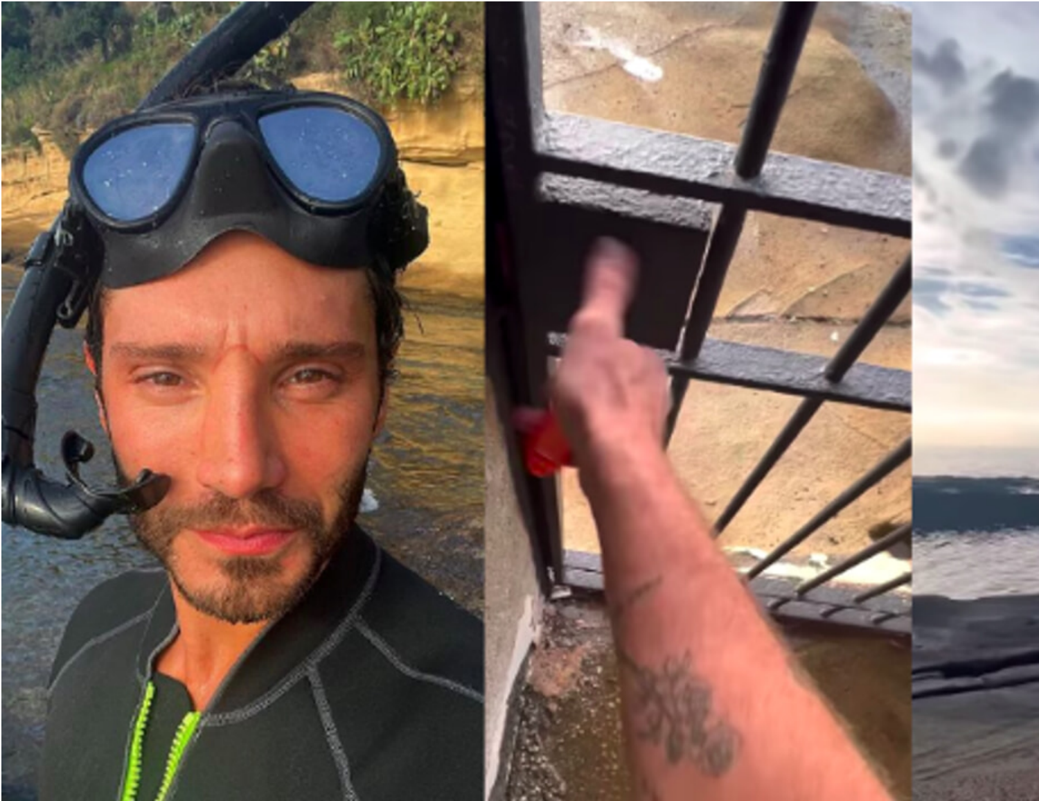
Stefano De Martino