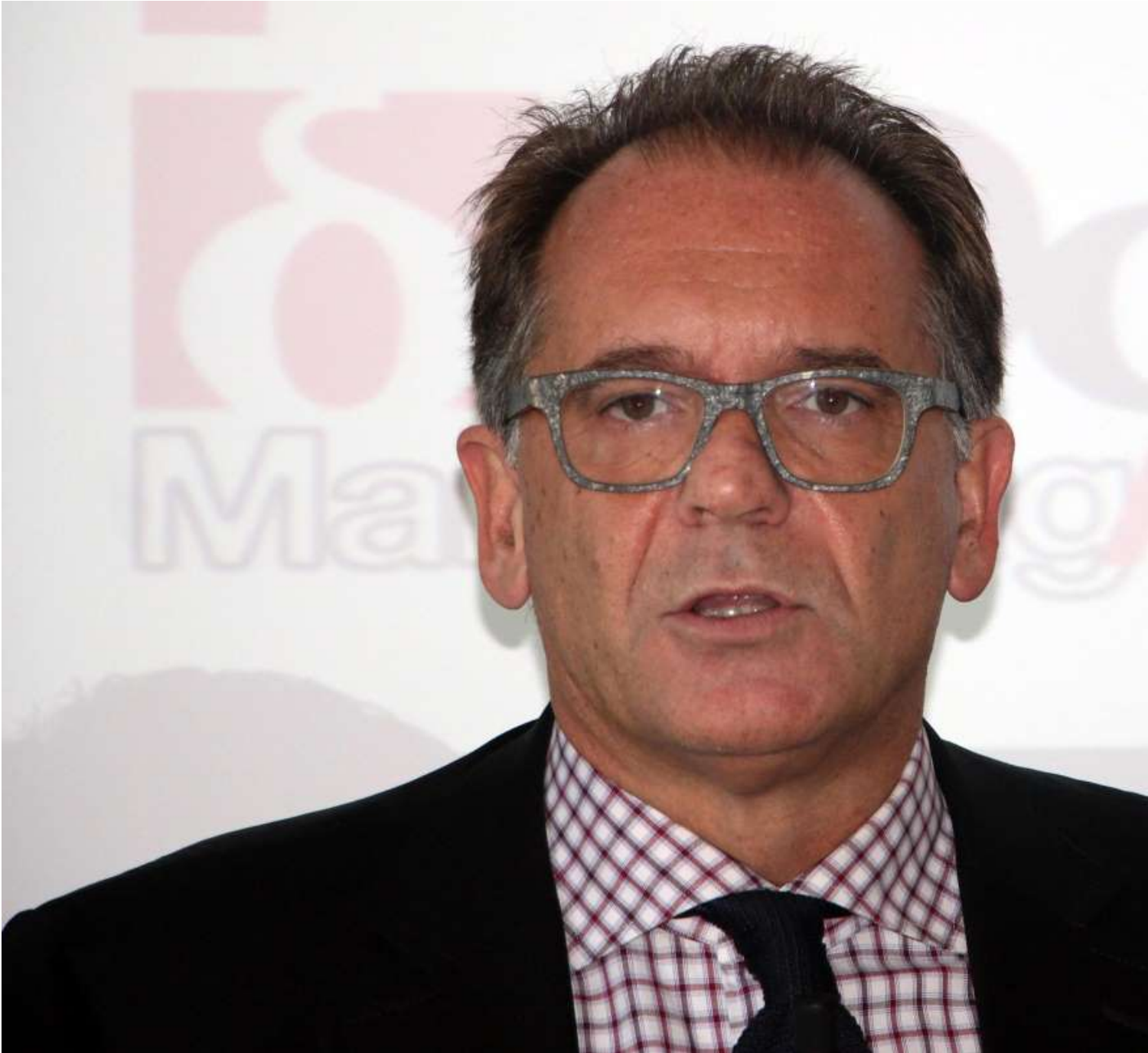
Alessandro Cecchi Paone

La scoperta dell' omosessualità può causare un senso di confusione in ogni adolescente; i ragazzi e le ragazze omosessuali, in particolare, devono affrontare una serie di sfide uniche nel corso dell'adolescenza. Oltre a imparare a capire la propria sessualità, i giovani gay e le giovani lesbiche devono affrontare situazioni complesse e pressioni che possono non essere rilevanti per gli adolescenti eterosessuali. Devono anche avere a che fare con genitori ostinati, amici ed altri che talvolta possono avere opinioni divergenti sull'orientamento sessuale.