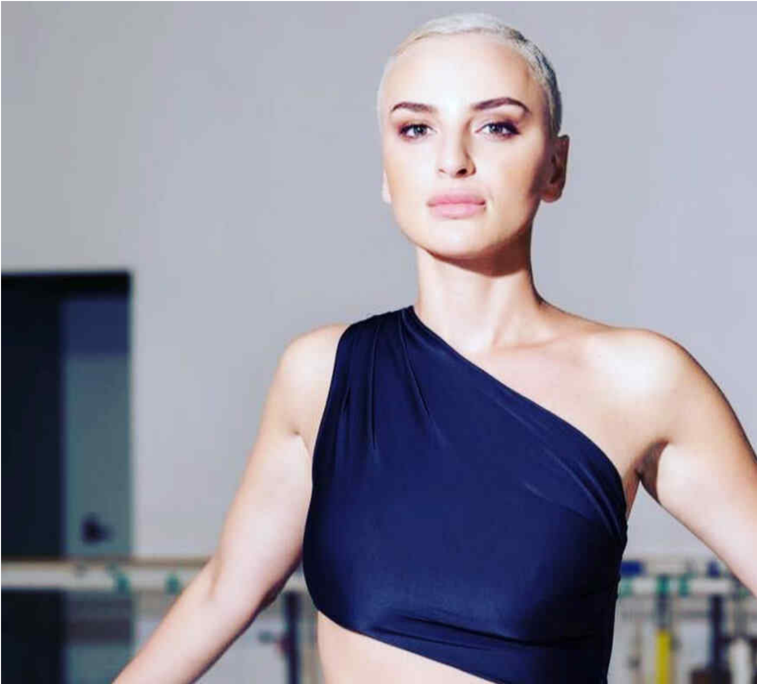
Arisa e il suo nuovo look.