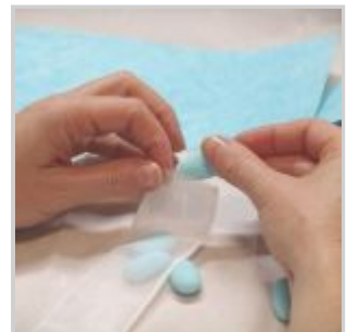
Tagliare 18 cm di tubolare per i confetti, inserire i cinque confetti nel tubolare