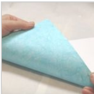
Tagliare la parte eccedente della carta di riso