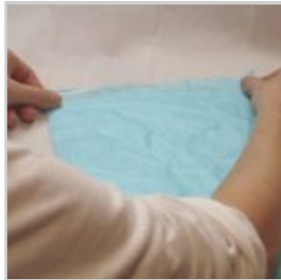
Fare attenzione a stendere sia i bordi che la parte centrale della carta di riso, attraverso movimenti delle mani come mostrato nelle figure che seguono