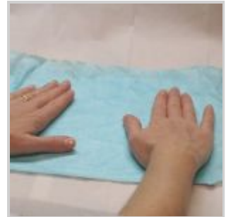
Movimenti delle mani per stendere la carta