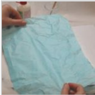
Terminata la stesura della colla sull'intera superficie, stendere il foglio di carta di riso sul cartoncino