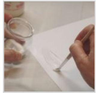
Stendere con cura la colla su un lato del cartoncino bianco A4 usando il pennello