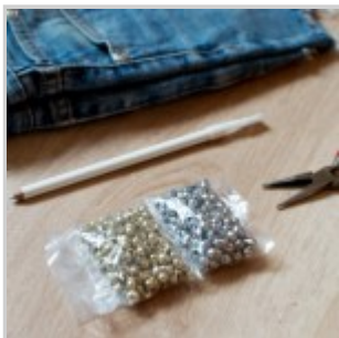
Occorrente per il tutorial