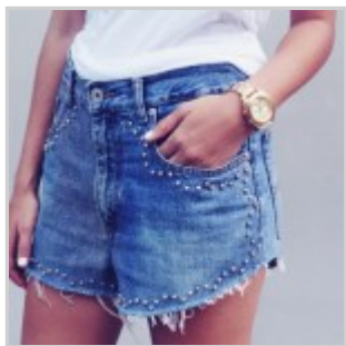
Short di jeans con le borchie

Riferimento articolo: https://www.donnaclick.it/come-fare/short-di-jeans-con-le-borchie-tutorial/