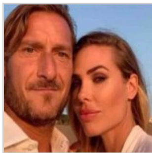
Francesco Totti e Ilary Blasi.